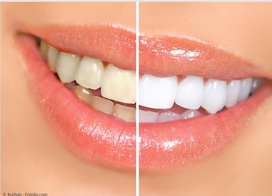
Deutlicher Unterschied: Professionelles Bleaching beim Zahnarzt wirkt!

Vertrauen Sie Ihre Zähne besser Profis an!