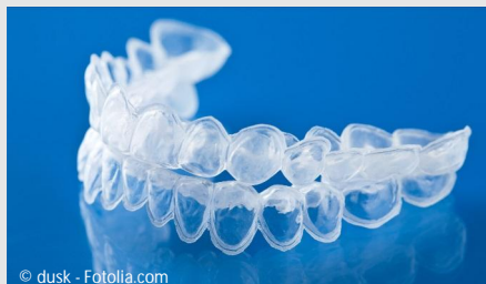
Bleaching-Form aus Kunststoff, in die Sie das Aufhellungs-Gel einfüllen.

Beim Home-Bleaching werden vom Zahnarzt dünne flexible Formen aus einem transparenten Kunststoff hergestellt, die genau auf Ihre Zähne passen (siehe Foto).