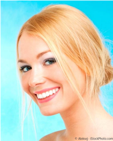
Bleaching vom Zahnarzt: Gewinnendes Lächeln mit strahlend weißen Zähnen

Professionelle Zahnaufhellung durch den Zahnarzt